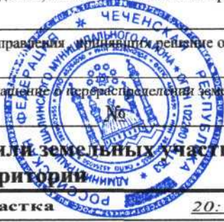
Схема расположения земельного участка или земельных участков на кадастровом плане территории