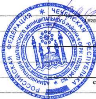
Схема расположения земельного участка наименование документа об утверждении, включая наименования

Шалинского района-20 р-та органов государственной власти или органов местного