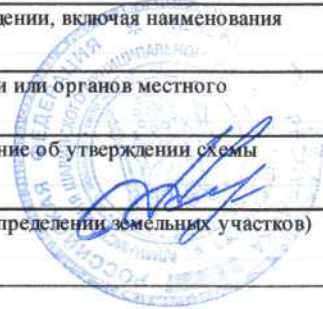
СХЕМА расположения земельного участка, на кадастровом плане соответствующей территории

(наименование документа об утверждении, включая наименования органов государственной власти или органов местного самоуправления, принявших решение об утверждении схемы или подписавших соглашение о перераспределении земельных участков) от _____ № _____