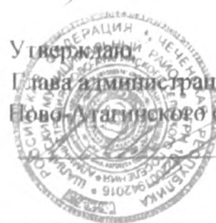
Схема Водопроводных сетей с. Новые-Атаги Шалинского района ЧР

Утверждено Глава администрации Ново-Атагинского сельского поселения А.М.Масаев