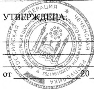
Схема расположения земельного участка на кадастровом плане соответствующей территории